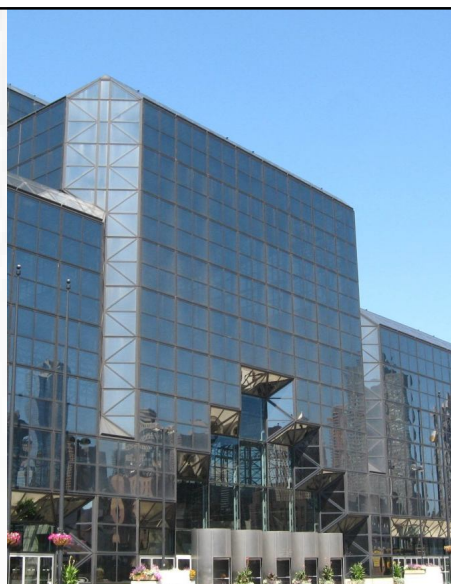
Jacob K. Javits Convention Center Nova York