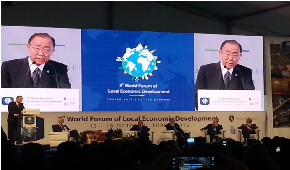
SECRETÁRIO-GERAL DAS NAÇÕES UNIDAS BAN KI MOON NA SEÇÃO PLENÁRIA DE ENCERRAMENTO