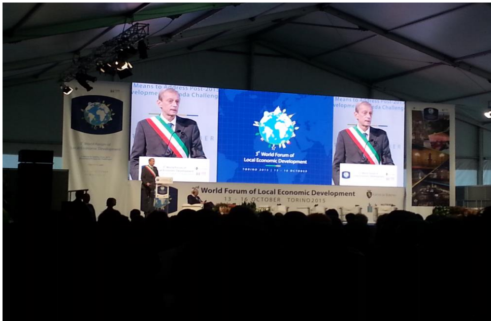
PREFEITO DE TURIM

O evento contou com a participação de mais de 2.000 pessoas de 130 países. O Prefeito de Turim falou na abertura do evento dia 13/10, na seção plenária do dia 14/10 e na seção de encerramento.