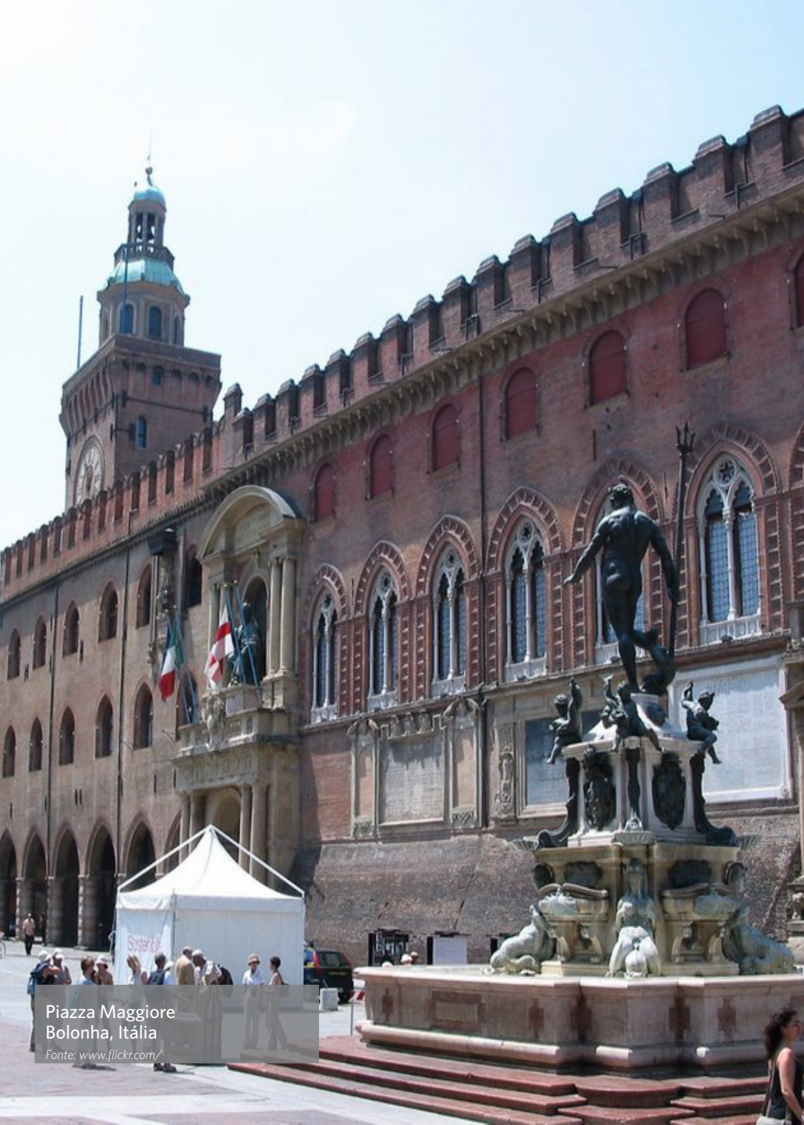
Piazza Maggiore Bologna, Itália