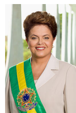
Dilma Rousseff Presidenta