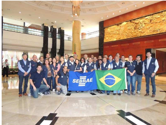
Figura 2 - Delegação de Roraima

O primeiro Grupo teve o primeiro dia livre para descanso, pois nos dois dias seguintes houve duas feiras de tecnologia. Uma, específica sobre equipamentos de hardware, e a outra sobre tecnologia. Ainda na cidade de Hong Kong, no segundo dia de estadia, ainda houve tempo para um city tour, para conhecermos a cultura local e a história da cidade que um dia fez parte do Reino Unido. Visitamos o principal ponto turístico da cidade, além de um templo budista no alto de uma montanha. Esse passeio serviu para aproximar mais o primeiro grupo, e fazer com que todos tivessem um dia diferente do que estava por vir durante a feira.