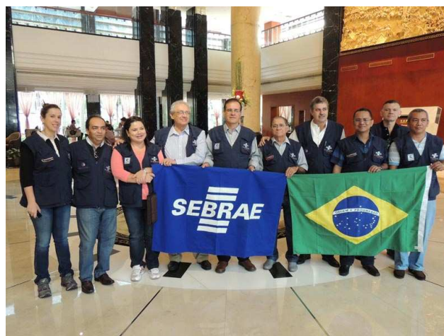
Figura 3 - Diretoria e Conselheiros

O primeiro Grupo teve o primeiro dia livre para descanso, pois nos dois dias seguintes houve duas feiras de tecnologia. Uma, específica sobre equipamentos de hardware, e a outra sobre tecnologia. Ainda na cidade de Hong Kong, no segundo dia de estadia, ainda houve tempo para um city tour, para conhecermos a cultura local e a história da cidade que um dia fez parte do Reino Unido. Visitamos o principal ponto turístico da cidade, além de um templo budista no alto de uma montanha. Esse passeio serviu para aproximar mais o primeiro grupo, e fazer com que todos tivessem um dia diferente do que estava por vir durante a feira.