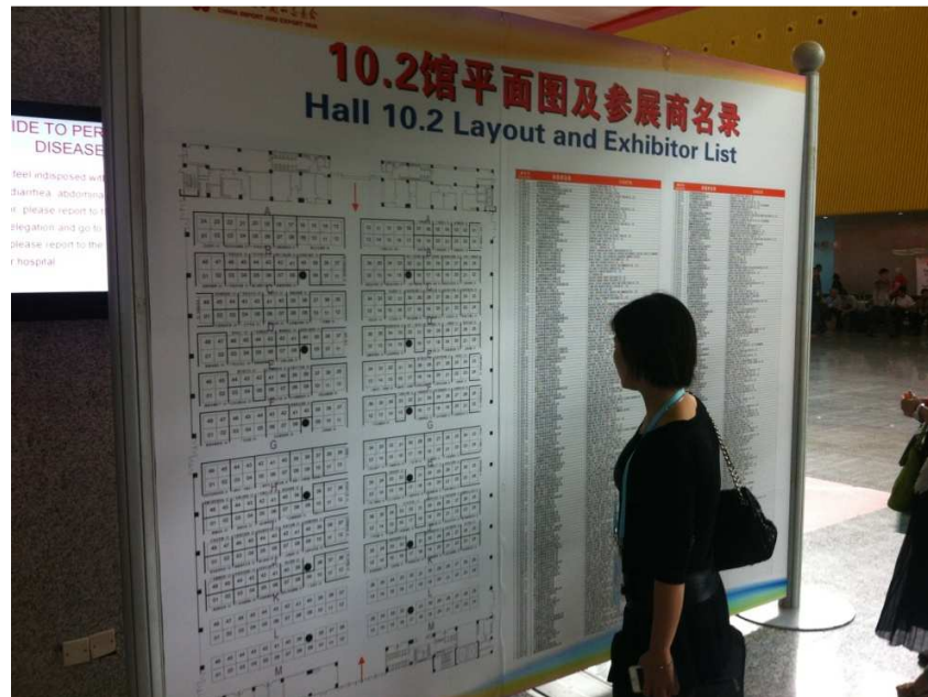
Figura 5 - Mapa de expositores de um setor da feira

Os pavilhões estão divididos por categorias, divididos por classes, sendo 24 tipos diferentes: eletrônicos de informática, elétrica (tomadas, fios e etc.), equipamentos de luz, veículos, máquinas pesadas e largas, material de construção, e entre outros.